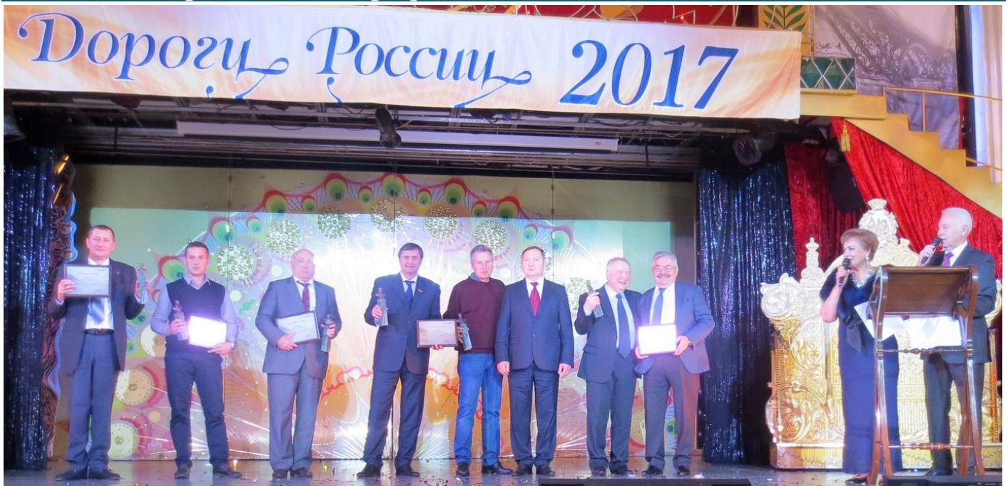
На фото: победители в номинации "За выдающийся вклад в развитие дорожной отрасли"

Среди лучших - три территориальные и четыре первичные организации профсоюза РОСПРОФТРАНСДОР